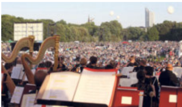
Morgen und Samstag laden das Gewandhaus und Porsche wieder zu „Klassik airleben“ ins Rosental ein

Im Rosental finden’s die beiden schon spannender – aber nur ohne großes Publikum. Pisaroni: „Die vielen Menschen beim Open Air wären Stress für die beiden. Sie bleiben im Hotel.“